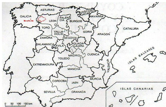
IMAGEN IV: Distribución administrativa de la monarquía hispana en el Antiguo Régimen.

La zona delimitada por una línea roja que aparece en León es un añadido para señalar el Bierzo, lo mismo que el punto rojo que sitúa Monforte, capital del Estado condal de Lemos, casi en línea recta con Ponferrada y conectadas a través del cauce del Sil.