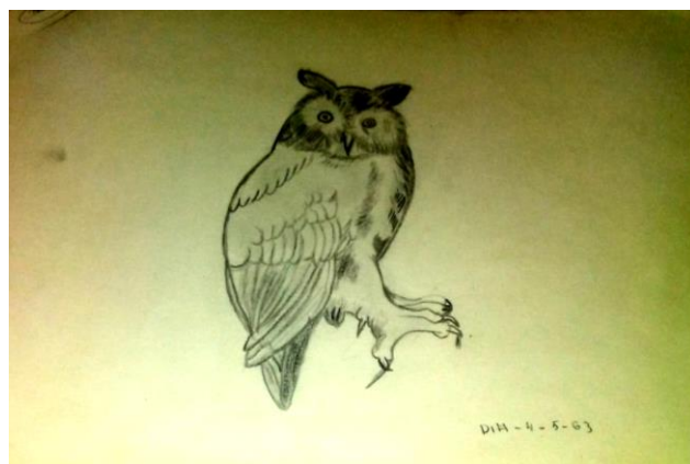
IMAGEN VI: Dibujo escolar de 1963

Obra literaria, en la que en la que se finge una especie de Junta o Cortes de aves, convocadas por una bandada de tordos vizcaínos, que no querían dejar participar al búho gallego que sólo contaba con la protección del águila real que va a acabar imponiendo el orden. Obra en la que se defiende Galicia, lo gallego y su españolidad y que ha sido considerada como una alegación literaria de la petición del derecho a voto describiéndose en ella una reunión de aves presidida por el águila real representando, cada una de ellas, los diferentes territorios que integraban la Hispania de principios del siglo XVII y que el autor va a describir con los siguientes términos: “tordos vizcaínos que cantan en vasco, lengua judía, para obligar al búho gallego a abandonar el prado donde anidaban las demás aves, lagarteros navarros que tan bien son franceses como no, cucos de Aragón que por perezosos no expulsaron a los musulmanes antes, aves de rapiña catalanas, mirlos valencianos, golondrinas murcianas donde tantos gallegos hay, pavos andaluces, jilgueros portugueses donde tan altos gallegos hay, avutardas menores manchegas y gansos de Castilla” (sic). 148