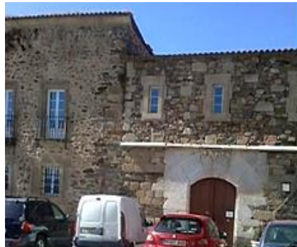
IMAGEN I: Torre del Homenaje y portada entrada principal palacio condal de Lemos en la acrópolis monfortina de S. Vicente. (Mayo 2020)

Resumen: Breve estudio de las Juntas, como una institución intermediaria entre la Monarquía y el Reino de Galicia, en el contexto del sistema de gobierno y de administración de justicia, urbano y rural gallego, así como del sistema real de fiscalidad y reclutamiento de soldados.