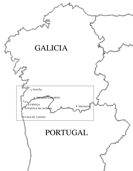
IMAGEN VII: Escenario del conflicto en la frontera entre Galicia y Portugal.

Victorias gallegas tras las cuales se va a entrar en una profunda fase de estabilidad de fronteras así el año 1659 va a señalar el final de las hostilidades con Francia (Paz de los Pirineos) sólo perturbada en 1662, en el contexto de la Guerra con Portugal, por el intento fracasado de conquistar Valença do Miño.