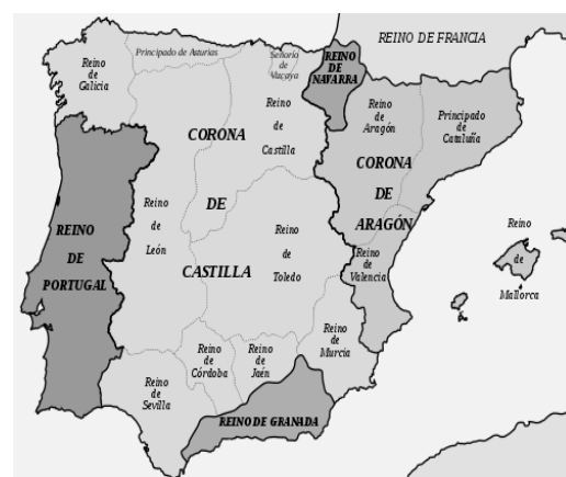
IMAGEN II: Mapa político de la Península Ibérica al inicio del reinado de los Reyes Católicos.

Así, la subida al trono de Castilla de Dña.