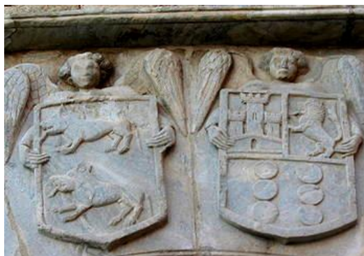
IMAGEN III: Escudo sobre puerta de entrada al palacio de la Casa condal de Lemos en Monforte con los emblemas de los seis roeles de los Castro (parte inferior derecha), el león y el castillo de los Enríquez (parte superior derecha) y los dos lobos de los Osorios (izquierda). (Mayo 2020)

1ª) La familia de los Castros, cuya rama gallega fue fundada por Fernán Gutierrez (1190-1240), hijo mayor de Gutierrez Rodríguez de Castro y Elvira Osoreo, que desempeñó varios cargos en la Corte y que será, entre otros cargos, tenente 65 de Lemos y pertiguero mayor de Santiago 66 participando, también, en la batalla de las Navas de Tolosa (1212), le sucede su hijo Esteban, señor de Lemos y Sarria, pertiguero mayor,