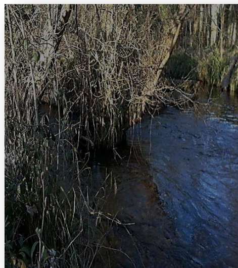
IMAGEN V: Río Seco vertiendo sus aguas en el canal de la aceña del Caneiro. Febrero 2019