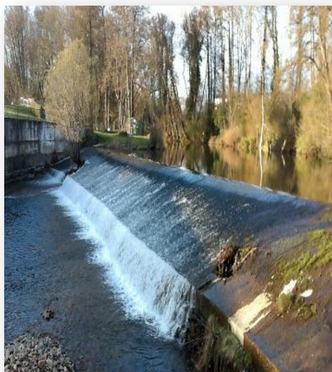
IMAGEN IV: Dique de la presa de la aceña del Caneiro cara o vista aguas abajo. Febrero 2019

relieve las dos aceñas del monasterio de S. Vicente del Pino construidas en las inmediaciones en las que un riachuelo o arroyo vertía sus aguas en el río Cabe, así la única que se conserva de las dos (Caneiro) fue levantada en la zona norte de la villa, lugar por donde entra el río Cabe, 67 procedente de la feligresía de Ribas Altas, y justo un poco aguas abajo del lugar en el que el río Seco desembocaba en el río recogiendo sus aguas el canal por el que transcurría el agua desviada por la presa del río en dirección a la aceña con lo cual se aumentaba el volumen de ésta que se controlaba a través de una compuerta vertiéndose la sobrante, a través de un canal, en el curso del río Cabe, como pone de relieve la tres imágenes inferiores: