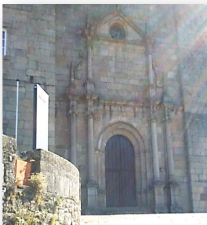
IMAGEN I Iglesia parroquial de S. Vicente del Pino. Setiembre 2018