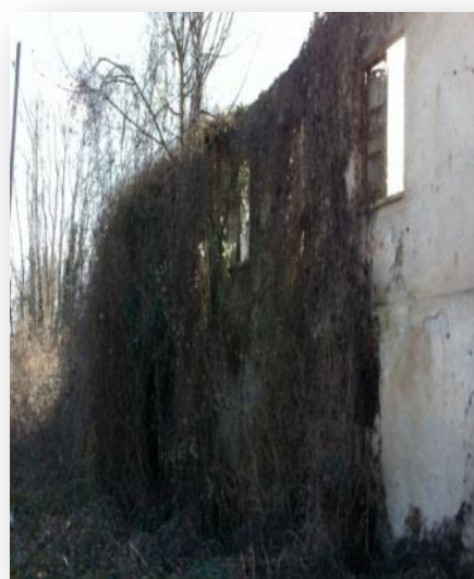
IMAGEN X: Izquierda dique de la presa actual de S. Lázaro. Derecha ruinas aceña de Cobas. Abril 2019