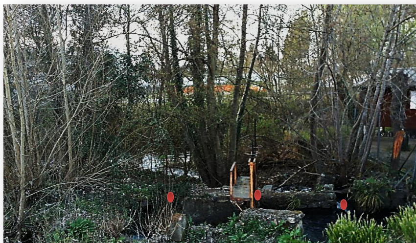
IMAGEN VI: Vista desde arriba de la compuerta que regulaba el paso del agua desviada del río por un canal a la aceña y del canal de desvío, aliviadero o vertedero del sobrante al río. Izquierda compuerta y ruinas aceña situada en la margen izquierda del río. Marzo 2019.