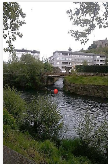
IMAGEN VII: Arroyo Zapardiel desembocando en el río Cabe aguas arriba de la presa de la Peña. Abril 2019

Y, si bien, la presa ha sido derribada, sin embargo, sí se conserva parte de la casa-molino e infraestructura hidráulica que conducía el agua al molino y cuya fecha de construcción no se ha podido rastrear con anterioridad a mediados del siglo XVI, a pesar de su más que posible origen medieval fecha en la que se habían establecido en la villa monfortina los cluniacenses, a través de un documento notarial de 1557 en el que se recogen dos apeos 68 o deslindes de los bienes que va a aforar el monasterio junto con su posterior reparto o prorrateo entre los foreros siendo uno de ellos el de la “aceña de la Peña” junto con “el horno, casa y huertas” y el otro el “de la huerta del Caneiro de S. Vicente”.