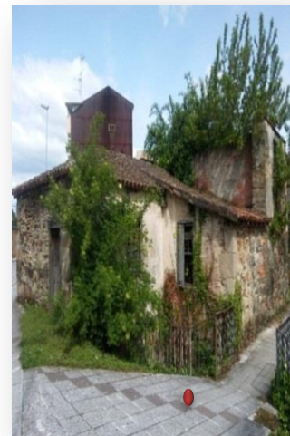
IMAGEN VIII: Izquierda canal de entrada de agua al molino. Centro casa molino y canal de salida o vertedero al río al fondo. Derecha entorno aceña situada en la margen izquierda del río. Abril 2019

Por otra parte, ambas aceñas parecen responder al prototipo de molinos señoriales medievales y otro tanto se podría decir de una de las pertenecientes a los jesuitas (“Carud/e”) como evidencian las imágenes inferiores: