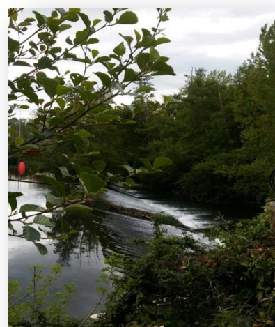
IMAGEN IX: Izquierda arroyo de las “Malloadas” desembocando en el río Cabe aguas arriba de la presa actual de Carud/e. Derecha dique de la presa y canal de la aceña en el fondo. Abril 2019