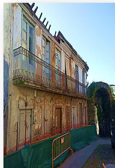
IMAGEN III: Fachada casa Pescaderías, fondo una de las puertas de entrada al recinto amurallado. Abril 2019

Carnicería a la que hay que añadir una Casa de Pescaderías cuyo abasto era también imprescindible debido al largo periodo de ayuno y abstinencia de la Cuaresma cristiana y que corría a cargo del Concejo el tenerlo garantizado, debido al proteccionismo reinante en todo lo referente a los considerados alimentos básicos (pan, vino, carne, pescado, nieve,...), por lo que se recurre, como en el caso de la carne, al sistema de obligados o “sistema de posturas” lo que suponía ceder la gestión de la venta al por menor a particulares que garantizaran al vecindario tanto el suministro como la calidad y un precio justo, especialmente en épocas de escasez (falta de abastecimiento por guerras, inclemencias climáticas,...), pero el hecho de que poseyesen ese derecho con carácter de monopolio o en exclusividad sin posible competencia llevaba con frecuencia a la especulación o retención de la salida del producto al mercado con la consiguiente subida de precios y enriquecimiento de los abastecedores u obligados, a pesar de la dura y abundante legislación en este terreno y al férreo control.