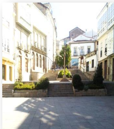
IMAGEN II Ubicación iglesia parroquial de Sta. M a de la Regla (siglo XVIII). Setiembre 2018

SUMMARY: Monforte is a new example of how could be applied the analysis of a small town not only to the knowledge of the local history but also to the understanding of this one in a broader context.