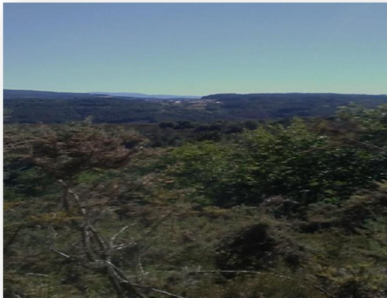
Imagen III: Vista de matorral y al fondo calvero de la parroquia de Torbeo, foto tomada desde el altopiano de la iglesia parroquial de Vilachá pudiéndose distinguir la línea divisoria marcada por el río Sil entre la ribera lucense y orensana. (Junio 2017)

f=ferrado=27 varas castellanas "en cuadro"=±502 m 2