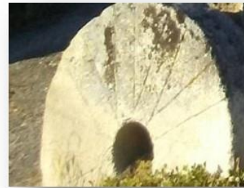
Imagen IV: Piedra de molino adosada al pie del Crucero del S. XX que precede a la iglesia parroquial. Junio 2017

Se trata, pues, de pequeños molinos de uso compartido por más de un vecino asociado (“consortes”) o por varios miembros de una familia (“los suyos”) para la molienda de sus granos de ahí que sólo funcionen parte del año ya que la carga de trabajo sería limitada y, a mayores, no se dice nada respecto a la falta de agua como el factor determinante de ese breve periodo de tiempo anual en que trabajan. No obstante, debió de haber algún molino anterior ya que una de las vecinas, Isabel Rodríguez la “Tejedora”, viuda de Pedro Guntiñas (Trasmonte), ubica en su relación de bienes un soto en “Muiño vedro” (“Molino viejo”).