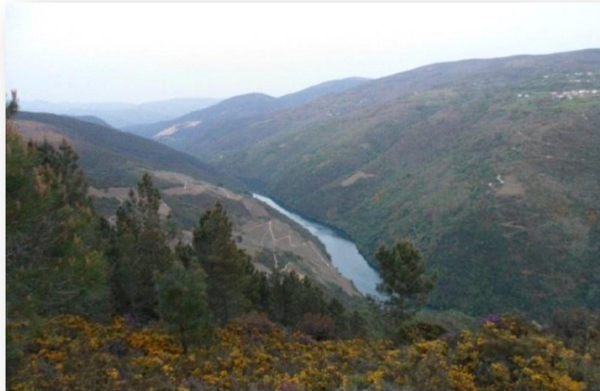
IMAGEN V: Cañones del Sil, margen izquierda imagen ribera de Vilachá (calvero de viña mezclada con matorral y arbolado), margen derecha Torbeo en la planicie, ribera con algún calvero de viña y camino en zigzag (Mirador de “Capela(n)”-Primavera 2016).

Cultivo de la vid ya perfectamente consolidado a mediados del siglo XVIII pero iniciado, al menos, en la Edad Media de la mano de los monjes repobladores ya que la propiedad directa o eminente de los viñedos se la reparten dos monasterios, el cluniacense de S. Vicente del Pino (Monforte de Lemos/Lugo) y el cisterciense de Montederramo (Ourense).