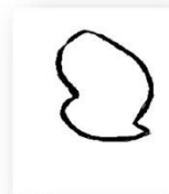
IMAGEN II: Plano de Vilachá

La feligresía comprende de levante a poniente \frac{1}{2} legua, de norte a sur \frac{1}{4} de legua y en circunferencia 2 leguas 7 (perímetro=11,14 Km.) y llevará 4 horas andarla “por lo quebrado del camino” limitando al levante con Quinta de Lor, al poniente con Sta. M a de Rozavales, al norte con S. Cosme de Liñares y al sur con el Coto de Frojende.